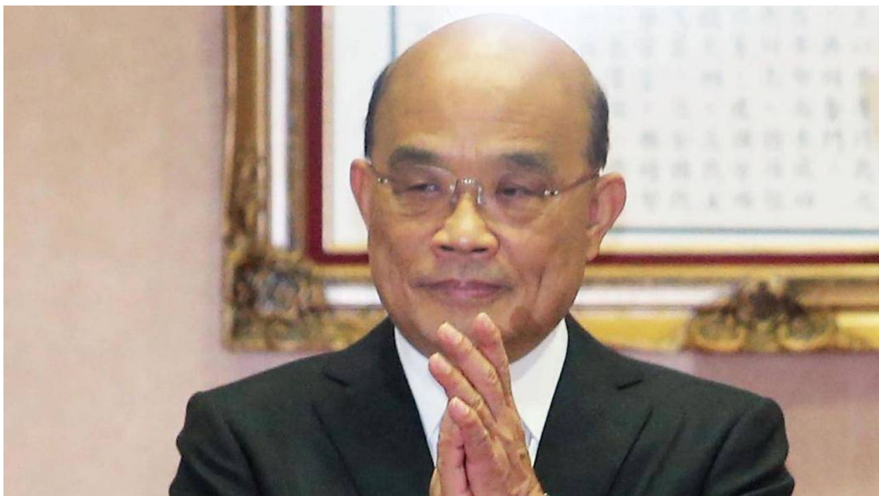
行政院長蘇貞昌。

行政院長蘇貞昌今（5）日指出，由於中國大陸的武漢肺炎疫情近日確診病例數持續上升，到4日已達到2萬例，涵蓋全中國大陸所有省市自治區，為了更有效守護國人同胞的健康，政府宣布從明（6）日起，所有中國籍旅客暫緩入境。